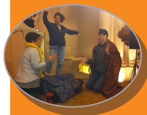
Une Nativité revisitée lors de la veillée de Noël

Comme chaque année, le 24 décembre au soir, nos quatre secteurs se retrouvent pour une veillée à Maguelone. Passant devant le temple, un jeune homme s'arrête devant l'annonce « Venez fêter Noël ! ». Il a la bonne idée d'entrer.