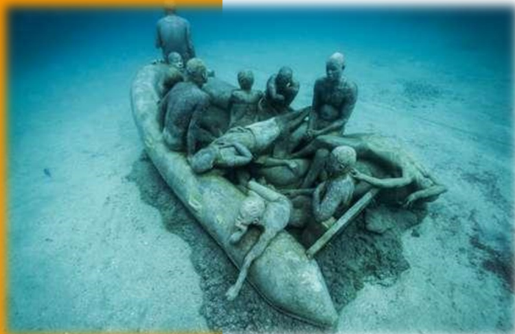
le radeau de Lampedusa de Jason deCaires Taylor

Pour inventer une solution humaine à la hauteur de cette situation migratoire complexe, les chrétiens ne pourraient-ils pas porter et incarner cette dynamique «devenir le prochain de l'autre» au cœur des administrations, des associations et partis politiques ? Ce faisant, chacun serait poussé à approfondir les solutions actuelles afin d'éviter des réponses rétrécies, purement techniques, procédurières ou idéologiques. En agissant ainsi, nous insufflerons au cœur des logiques de peur, une dynamique pleine d'espérance !