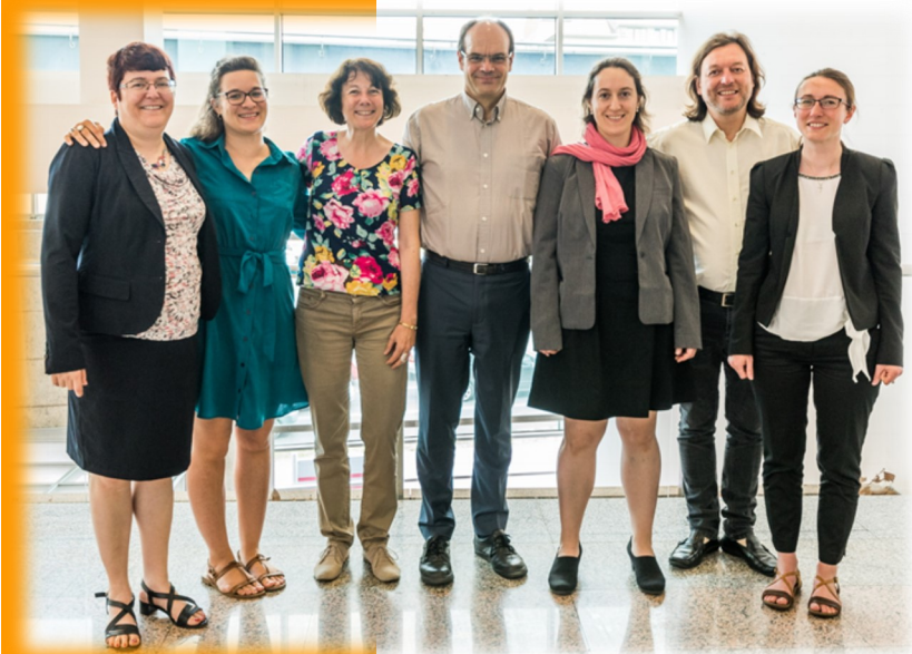
La délégation envoyée par l'EPUF.

Pour en savoir plus : www.egliseuniverselle.org