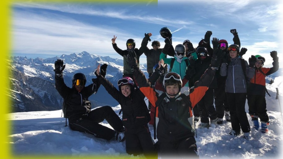
Camp de ski, hiver 2020