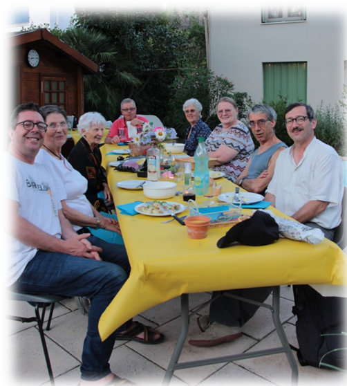
Repas fin d'année, Groupe partage biblique Maurin