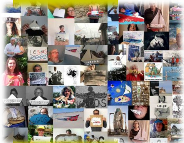
Mur de photos pour interpeller sur la situation des camps de réfugiés sur l'île de Lesbos, La Cimade

Dans ce brouillard du confinement et grâce au tissage de liens, les plus vulnérables ont su réagir à la précarité et ont donné la force aux associations de faire face à cette tempête avec créativité. L'espérance nous pousse à persévérer, nous apporte paix et sérénité dans ce qui adviendra.