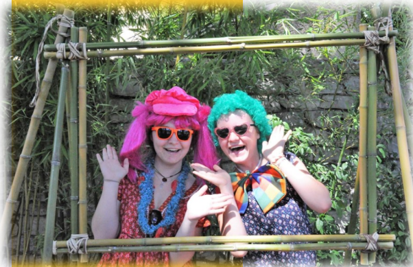
Photo prise lors de Par-paillots en fête, juin 2018 "Comment puis-je être assuré d'être moi ? L'Évangile déclare vaine cette question"

Comment puis-je être assuré d'être moi, en vérité ? Cette question, l'Évangile la déclare vaine. Car ma vérité n'est pas en moi, elle est hors de moi, en Christ. L'Évangile, c'est la promesse que Dieu, en Jésus, s'est engagé pour nous, sans mesure. Sa grâce nous suffit : elle nous dégage de l'impératif de devoir nous justifier à la mesure de nos propres engagements. Si l'Évangile est un miroir pour nos engagements, c'est pour nous assurer que la reconnaissance de notre identité nous vient d'Ailleurs, d'une Parole par laquelle Dieu nous donne un gage de sa fidèle amitié. Si Dieu pour nous s'engage, qui sera contre nous ?